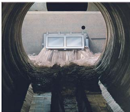
HydroSelf Schwallspülung in Kanalstauräumen